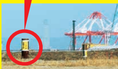
【しんぶん赤旗】提供 2024年3月31日付より