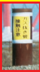
万博会場のガス抜き管の拡大写真