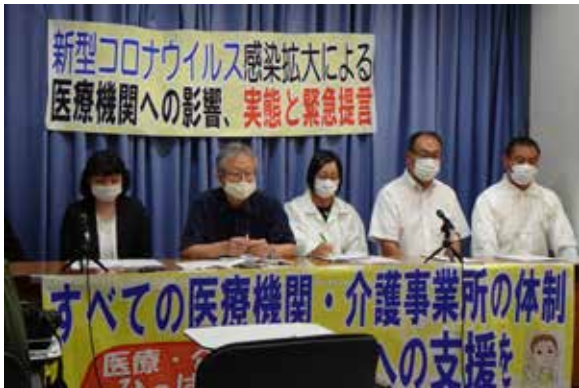
コロナ対策への支援強化を求める医療団体