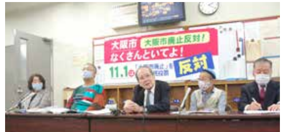
「都構想」反対を訴える文化人・教育関係者ら

「大阪市は歴史と文化の町」であり「なくしていいはずがありません」とのアピールに、210人を超える学者・文化人・教育関係者らが賛同。「大阪の人が長い間積み重ねてきたものを壊していいのか」「その都市の独特の文化があってこそ将来に向かう展望も出てくる」などの声が寄せられています。