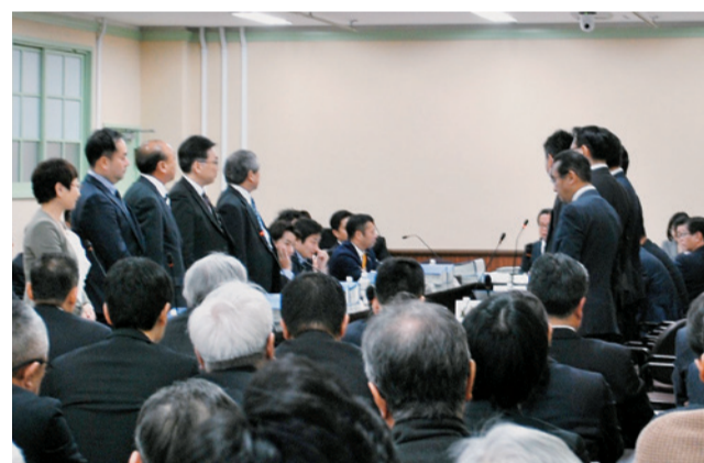
動議の採決を拒否する会長に対して、立ち上がって多数をアピールする 自民、公明、共産の委員=1月29日

「住民投票」で否決された「大阪都」。「維新」はまたも「住民投票を」と言い出しました。日本共産党市会議員団は、新たな「特別区」素案は「5区案」を「4区案」にしただけ、新庁舎などに600億円以上の重いコストがかかり、市民サービスの低下はまぬがれないと指摘。破綻した「大阪都」構想は断念し、市政をよくすることに専念すべきと主張しています。