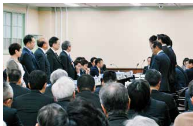
動議の採決を拒否する会長に対して、立ち上がって多数をアピールする自民、公明、共産の委員=1月29日

「住民投票」で否決された「大阪都」。「維新」はまたも「住民投票を」と言い出しました。日本共産党市会議員団は、新たな「特別区」素案は「5区案」を「4区案」にしただけ、新庁舎などに600億円以上の重いコストがかかり、市民サービスの低下はまぬがれないと指摘。破綻した「大阪都」構想は断念し、市政をよくすることに専念すべきと主張しています。