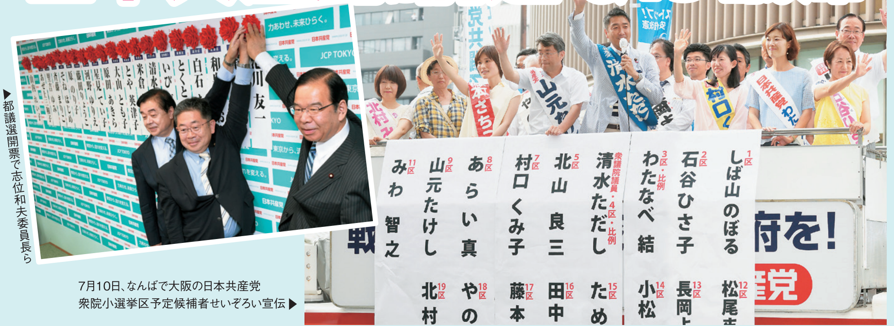
都議選開票で志位和夫委員長ら