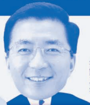
山下よしき 書記局長