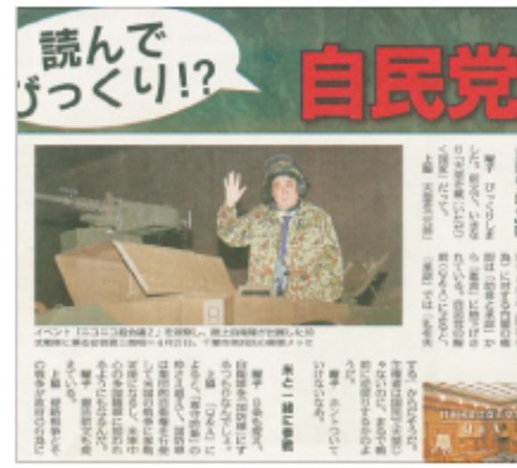
イベントで戦車に乗る安倍首相 【しんぶん赤旗】日曜版 2013年5月26日付