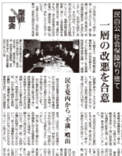
【しんぶん赤旗】2013年6月16日付