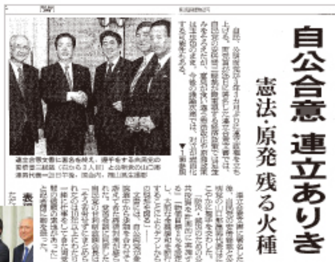
【朝日新聞】2012年12月26日付