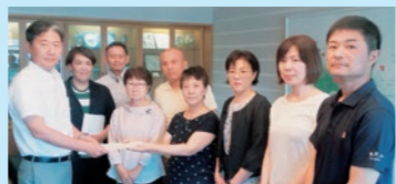
大阪府北部地震対策強化を求め、市会議員団と吹田市長に申し入れ