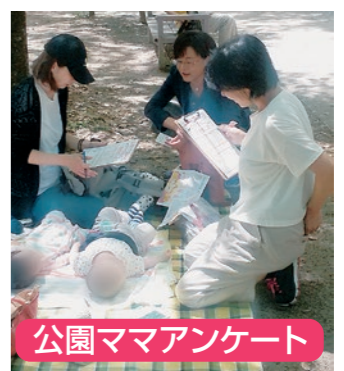
公園ママアンケート